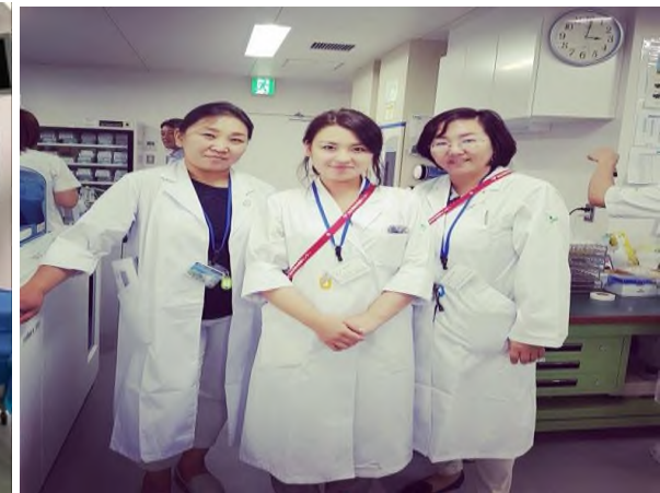
Зураг 3, 4. Япон Улсын төгсөлтийн дараах сургалт