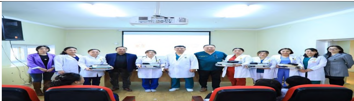
Зураг 12. Ерөнхий мэргэшил судлалын 2019-2020 оны хичээлийн жилийн нээлт

2019 оны 6-р сард Эрүүл мэндийн хөгжлийн төв болон Орхон аймгийн БОЭТ-д уулзалт сургалтыг зохион байгууллаа. Энэхүү сургалтанд Ховд, Өвөрхангай, Өмнөговь болон Дорнод аймгийн БОЭТ, мөн Нийслэлийн хоёр дүүргийн эмнэлгийн сургалт хариуцсан мэргэжилтнүүд оролцож туршилга солилцлоо.