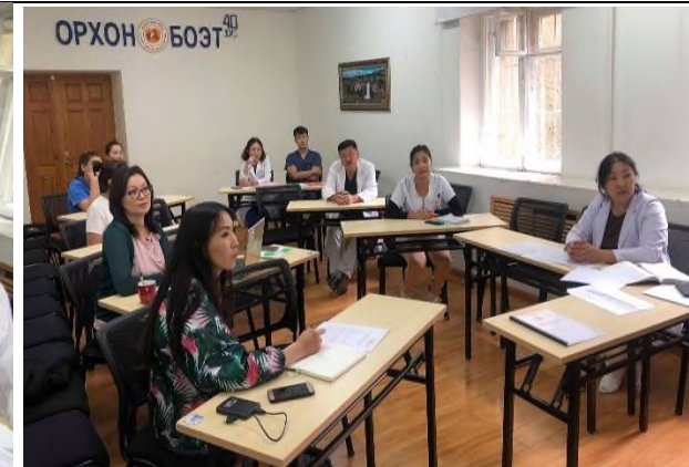
Зураг 9, 10 Сургалтын хяналтын зөвлөлийн хурал

2018 оны 10-р сарын 18-ны өдөр ЭМЯ-ны эмнэлгийн мэргэжилтний хөгжлийн зөвлөл хуралдаж Орхон аймгийн БОЭТ-ийг сургалт эрхлэх эмнэлгээр баталж 10 дугаар сарын 22-ны өдрөөс Ерөнхий мэргэшил судлалын сургалтыг эхүүлсэн. Сургалтын нээлтийн үйл ажиллагаанд төслийн гол хамтрагч талууд болох ЭМЯ-ны холбогдох удирдлага, аймгийн удирдагууд оролцож сургалтыг эхлүүлсэн. Тус сургалтаар 4 суралцагч нэг жилийн турш дотор, хүүхэд, төрөх эмэгтэйчүүд, яаралтай тусламжийн чиглэлээр тойрч суралцан, орон нутагт тусламж үйлчилгээ үзүүлэхэд шаардлагатай мэдлэг, ур чадвар, гардан үйлдлийг эзэмшин суралцаж 2019 оны 9 дүгээр сард төгссөн.