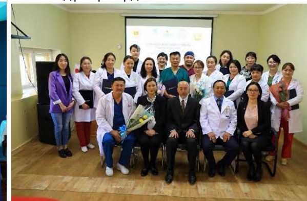
Зураг 11. Ерөнхий мэргэшил судлалын Төгсөлтийн арга хэмжээ ЭМХТ болон БОЭТ

2019 оны 10 сараас төслийн загвар эмнэлэг болох Орхон аймгийн БОЭТ-д Ерөнхий мэргэшил судлалын 2 дахь удаагийн сургалтад 5 суралцагч эмч нар элсэн суралцаж байна.