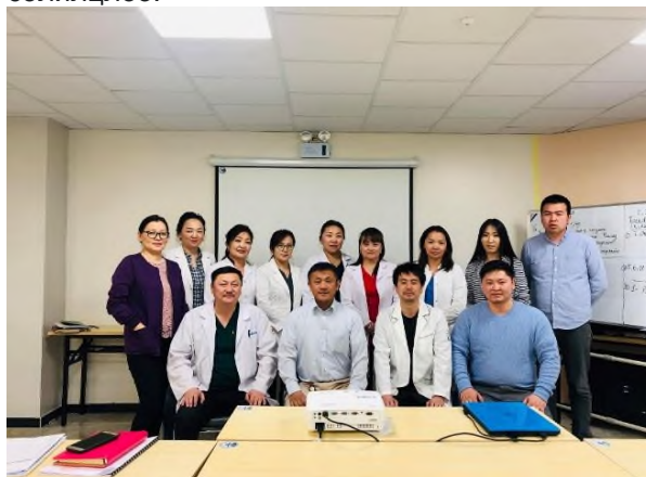
Зураг 13. Чингэлтэй дүүргийн эрүүл мэндийн төвийн Сургалтын албаны хамт

2019 оны 6-р сард Эрүүл мэндийн хөгжлийн төв болон Орхон аймгийн БОЭТ-д уулзалт сургалтыг зохион байгууллаа. Энэхүү сургалтанд Ховд, Өвөрхангай, Өмнөговь болон Дорнод аймгийн БОЭТ, мөн Нийслэлийн хоёр дүүргийн эмнэлгийн сургалт хариуцсан мэргэжилтнүүд оролцож туршилга солилцлоо.