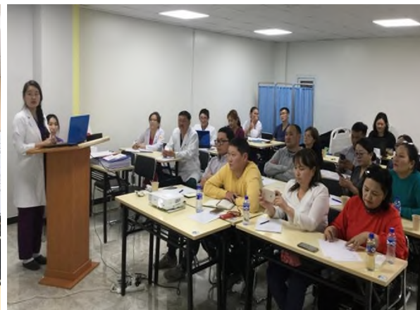
Зураг 14. Ховд, Өвөрхангай, Өмнөговь болон Дорнод аймгийн БОЭТ, мөн Нийслэлийн хоёр дүүргийн эмнэлгийн сургалт хариуцсан мэргэжилтнүүдийн хамт

Сургалтын хугацаанд ЭМЯ болон ЭМХТ-ийн үнэлгээ