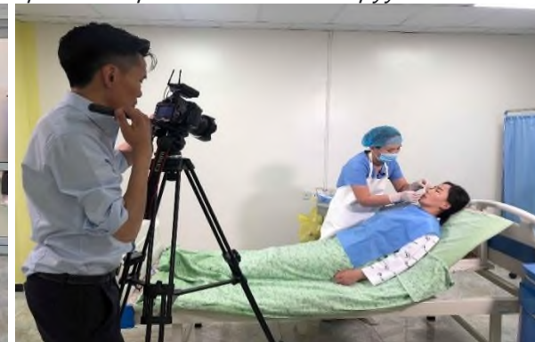
Зураг 7, 8. Төгсөлтийн дараах хөтөлбөрт тусгагдсан зайлшгүй суралцах гардан үйлдлийн гарын авлага болон видео боловруулах ажлын хэсэг

БОЭТ-ийн захирлын тушаалаар томилогдсон “Төгсөлтийн дараах сургалтын хяналтын зөвлөл” ажиллаж, Ерөнхий мэргэшил судлалын сургалтын журам, хөтөлбөр, төлөвлөгөө, хуваарийг хэлэлцэн батлаж, төгсөлтийн дараах сургалтын хэрэгжилт, үйл ажиллагаанд хяналт тавьж ажилласан. БОЭТ-ийн болон Сүлжээ эмнэлгийн сургалтын хяналтын зөвлөл нь өнгөрсөн хичээлийн жилд нийт 7 удаа хуралдаж, сургалттай холбоотой 38 асуудлыг хэлэлцэн шийдвэрлэсэн.