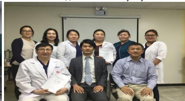
Зураг 5. Хүүхдийн судлалын тойролтын гарын авлагыг боловсруулсан ажлын хэсэг