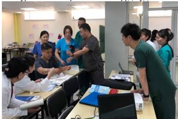
Зураг 6. Эх барих эмэгтэйчүүд судлалын тойролтын гарын авлагыг боловсруулсан ажлын хэсэг