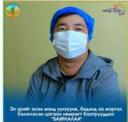
Эх үрийг эсэн мэнд үүлзуулж, бидэнд аз жаргал бэлэглэсэн цагаан нөмрөгт баатрууддаа "БАЯАААААА"