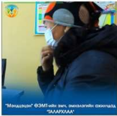
"Мэндэлцэн" ӨЗМТ-ийн эмч, эмнэлэгийн ажилчдад "АААААААА"