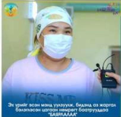
Эх үрийг эсэн мэнд үүлзуулж, бидэнд аз жаргал бэлэглэсэн цагаан нөмрөгт баатрууддаа "БАЯАААААА"