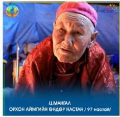
Ц.МАНГАА ОРХОН АЙМГИЙН ӨНДӨР НАСТАН / 97 настай /