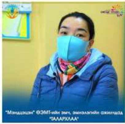
"Мэндэлцэн" ӨЗМТ-ийн эмч, эмнэлэгийн ажилчдад "АААААААА"