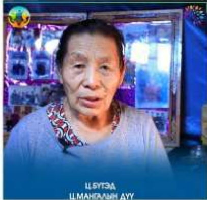
Ц.БҮТЭД Ц.МАНГААНЫ ДУУ